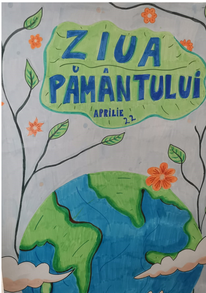
Reducerea amprenteii de CO2