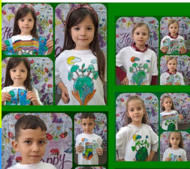
Tricouri personalizate - Planeta Terra, Planeta Albastră

Ziua Pământului a fost marcată pe 22 aprilie în școlile din județul Suceava „Pământul este ceea ce avem toți în comun.” (Wendell Berry)