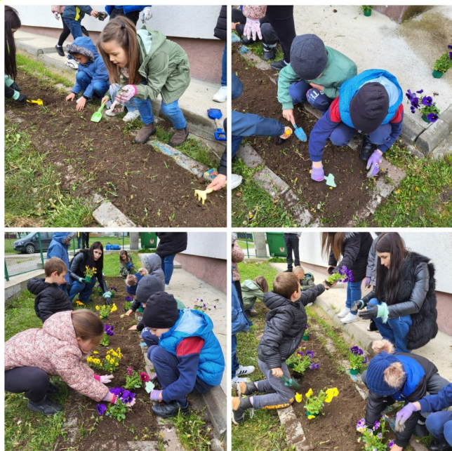
Școala Primară Luncușoara - Udești Plantăm în curtea școlii

151 de unități școlare au desfășurat Săptămâna Verde în perioada 22 - 26 aprilie 2024.