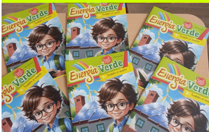
Școala Gimnazială Verești Energia Verde