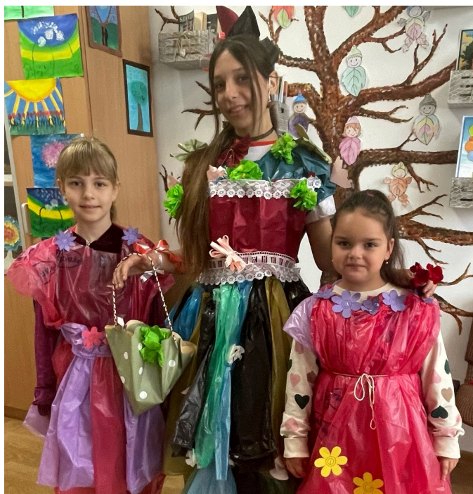
Școala Gimnazială Berchișești 3R: Reducere, Reutilizare, Reciclare