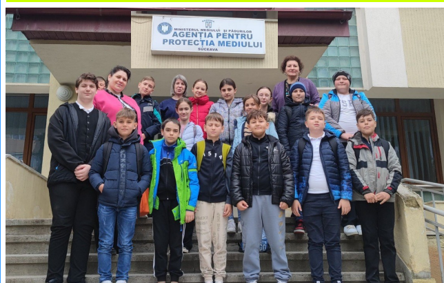
Școala Gimnazială Corocăiești Agenția de Protecție a Mediului - vizită